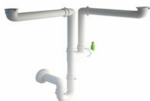
Diagrama de instalación